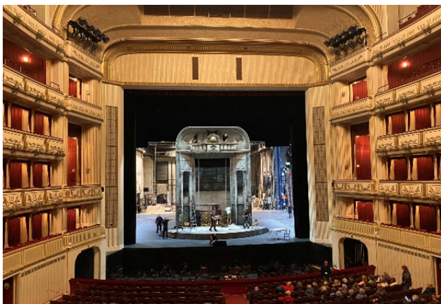
維也納歌劇院內部