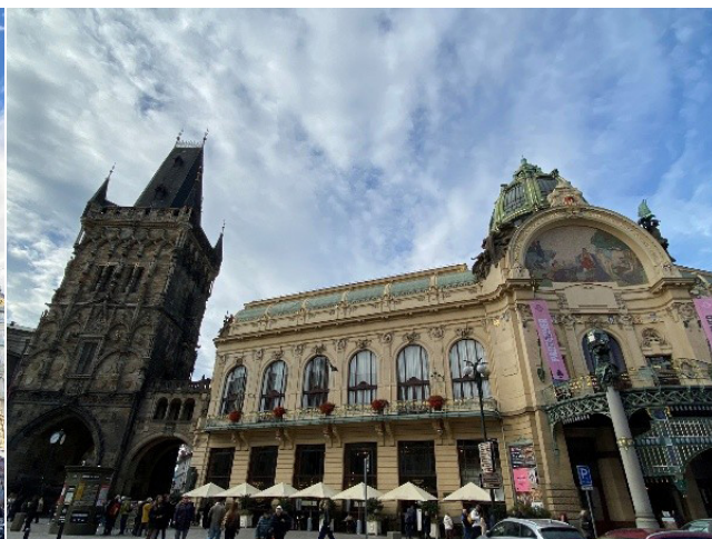
捷克布拉格市民會館（新藝術風格）