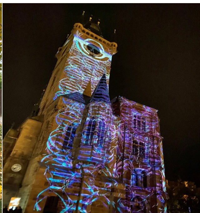
科技與人文結合 - 布拉格光影藝術節