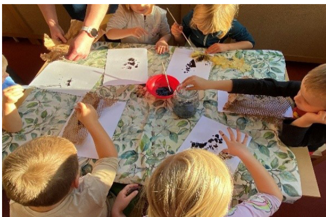
捷克布拉格幼兒園孩子在老師引導下運用撿拾的落葉及應用各種特殊質感素材進行拓印創作