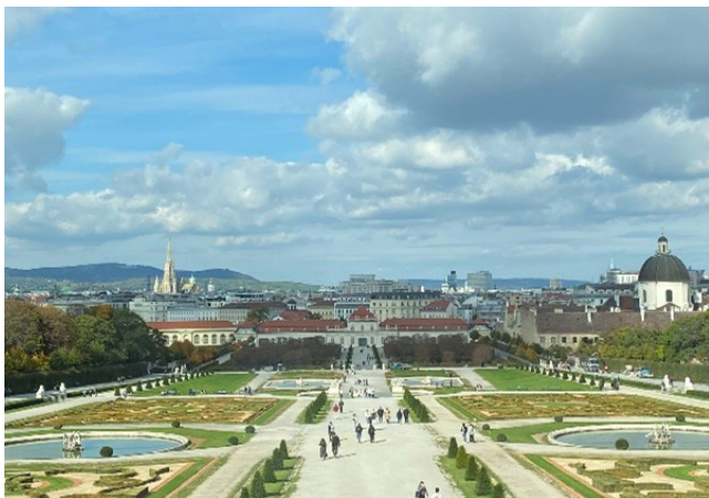
維也納美景宮花園