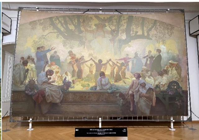
慕夏 - 《斯拉夫史詩》系列作品