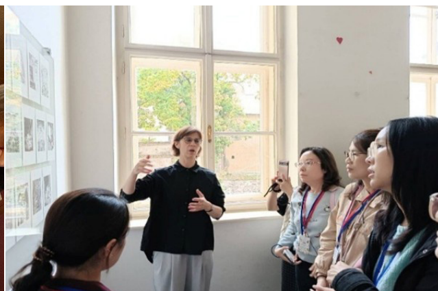
捷克布爾諾設計中學老師解說學生版畫作品 源自當地傳說故事