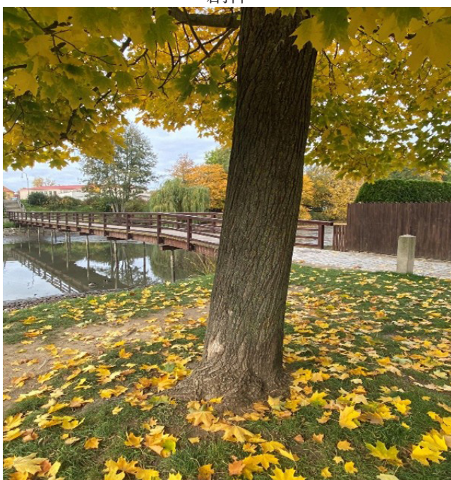
色彩飽滿的秋日自然美景