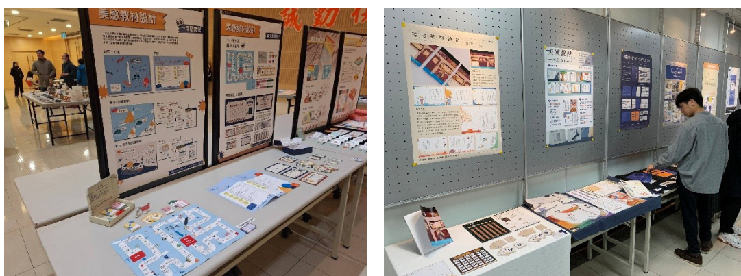
圖五、美感教材設計課程學生成果：期末展示