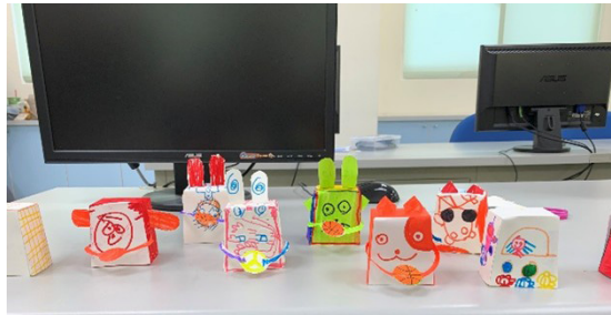
圖七、美感教材設計課程延伸至高教深耕之服務學習（新竹特殊教育學校）