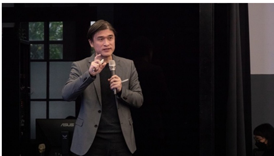
圖二、2021 教育設計論壇：美感教科書研究計畫分享