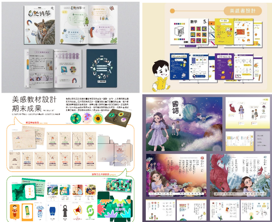
圖四、美感教材設計課程學生成果：學期作業

樣本與教材教具之陳列（圖五），並挑選優秀作品於系穿廊與展覽櫃進行長期性的陳列與展出（圖六），以及尋找書店與教育出版相關廠商進行產學合作洽談。同時，將課程內容延伸至高教深耕之服務學習內容，連結資訊工程科系，設計適合身心障礙學童之美感美育教材，進一步推展全民美感教育（圖七）。許多修習該門課程的學生在畢業專題的主題選擇上，以教育心理和社會文化相關的教材教具從事設計與創作，進一步拓展其影響力（圖八），從而使得該批學生在畢業後的就職方向以教育、出版設計為主軸，得以將美感教育的種子散播出去。