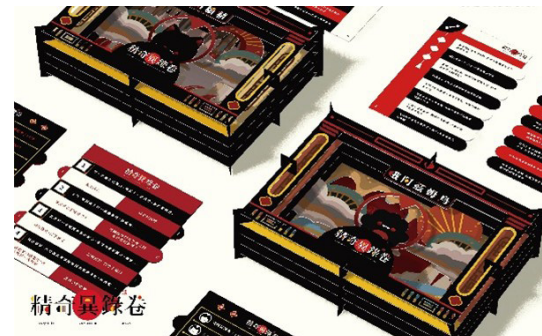
圖八、美感教材設計課程學生畢製作品