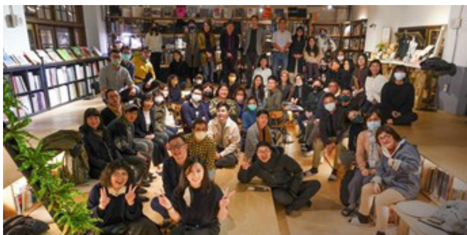
圖三、教科書設計交流會：活動合照（後排右五為筆者）