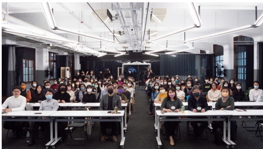
圖一、2021 教育設計論壇：活動合照（前排左三為筆者）