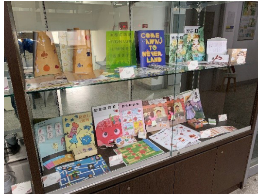
圖六、美感教材設計課程學生成果：常態展出