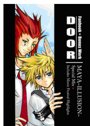
圖 1 同人 1，以 MAYA Illusion Special Mix +Door 繪製（2007）

集體決策方式釐定，尤以非正式會議為主。正式會議一般在團體成員家裡或公共地方舉行；除定時的正式會議外，團體成員亦會透過 MSN、Blog、專屬網站及電話聯絡等非正式和不定期的會議方式聯絡和作出決策。就漫畫同人誌團體的創作內容和表現形式方面，均參考自日本動畫和漫畫，創作的內容雖然改編自當季流行的日本動畫和漫畫，但卻加入本土故事情境（參圖 1 及圖 2）。