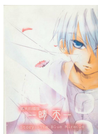
圖 2 同人 2， 晴天 （2007）

儘管原著有所改變，但卻堅持保留原著人物的形象、性格和風格為創作藍本。創作步驟方面，社群會就動畫、漫畫展銷會時間表擬定創作大綱，然後分工進行創作與宣傳。就生產和銷售方面，漫畫同人誌團體的作品主要定期於本地週年漫畫同人誌團體展銷會活動中進行販售。漫畫同人誌團體社群每年均參與由香港城市大學學生會屬會、動漫畫同人誌團體籌辦的「秋祭／萌之祭」同人誌即售會及香港專業教育學院主辦的「螢の祭」同人誌即售會，在活動中所銷售產品的種類計有漫畫同人誌單行本、限量彩色圖畫、書籤和徽章。單行本漫畫成為市場主打產品，每本售價為 HKD25 至 30。以 100 本漫畫單行本為例，一般可在展銷會中全數出清，推廣方法主要靠觀賞者的口碑和在漫畫同人誌團體專屬網站的宣傳。除經營漫畫同人誌產銷的工作外，漫畫同人誌團體社群亦注重與觀賞者建立的社群關係。漫畫同人誌團體均設有自己的專屬網站，作為與讀者溝通的平台。讀者可以透過網上發表和分享對作品的評價，討論創